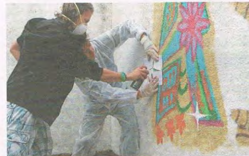
Auch Spraysen will gelernt sein.