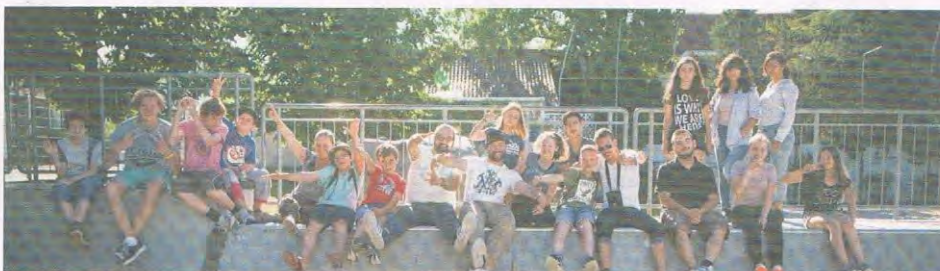
Die jungen Hip-Hop-Künstler beim Gruppenfoto auf der Rampe