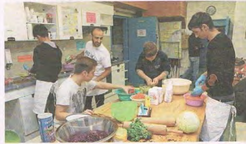
Frische Zutaten wurden in der „Funky Kitchen“ zu leckeren Speisen verarbeitet.