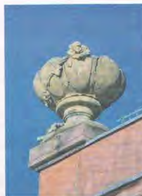
Die verbliebenen Vasen wiesen deutlich sichtbare Sprünge auf.

Die Vasen auf den Zirkelbauten sind ein ganz typisches Element der barocken Architektur: Sie beleben die Silhouette der Bauten und setzen Akzente. Wie die zahlreichen Figuren, für die der Schlossgarten von Schwetzingen berühmt ist, gehören sie zum Ensemble von Schloss und Schlossgarten und tragen zur Gesamtwirkung der einstigen Sommerresidenz bei. Bei den insgesamt acht Vasen auf den Zirkelbauten handelt es sich um Abgüsse der Originale, angefertigt in den 1970er-Jahren. Die wertvollen Originale des 18. Jahrhunderts, zumeist aus Sandstein, werden größtenteils in der Orangerie des Schwetzinger Schlossgartens gezeigt, wo sie vor Witterungseinflüssen geschützt sind.