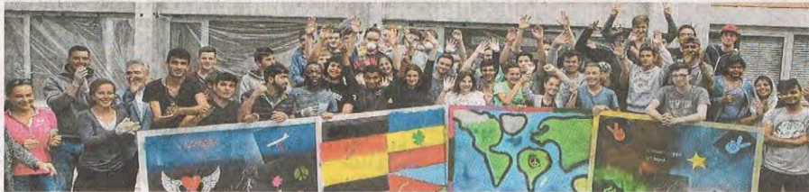
Sie können sich selbst bejubeln: Die Jugendlichen haben mit dem Kunstprojekt gezeigt, das Zusammenhalt stark macht.