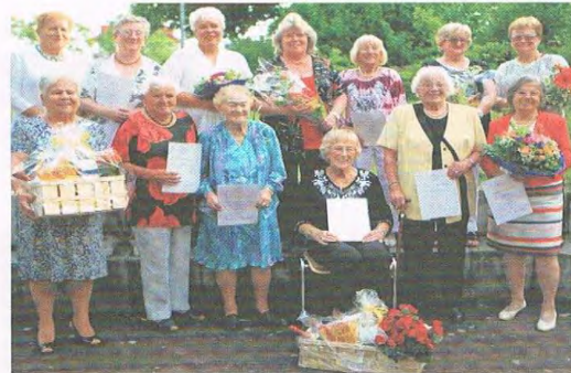
Zum 50. gab es zahlreiche Ehrungen.