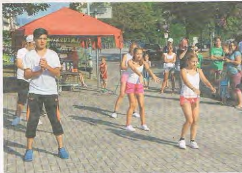
Einige Jugendliche hatten für das Projekt eine Hip-Hop-Choreographie erarbeitet.