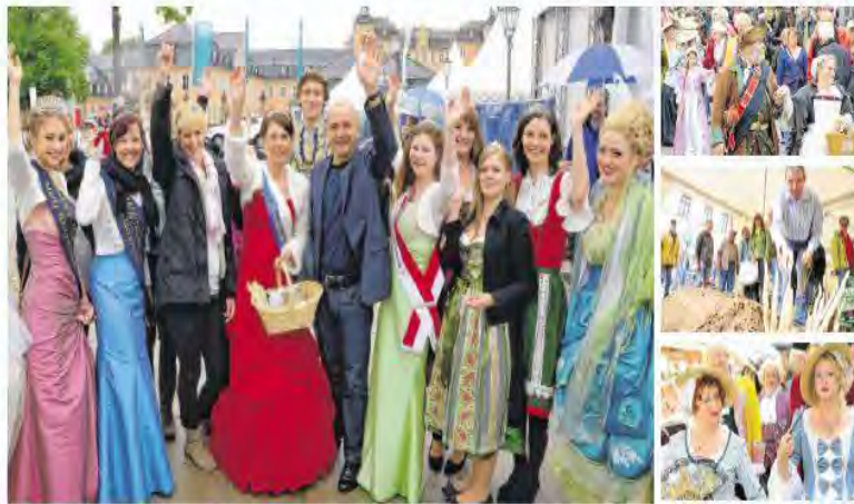
Von der Urkunderzeichnung in den Lorscher Codex vor 1250 Jahren, übers Mittelalter und den Barock bis in die Neuzeit reicht der Reigen der Programmpunkte beim Spargelfest am 11. Juni. Klar, dass wieder jede Menge Hühner bei Katharina L. (mit dem roten Kleid) zu Gast sind, aber auch die Kunst des Spargelstochens wird erklärt.

Auf der „Kleine-Planken-Bühne“ von Stadtmaking und Schwetzingener Zeitung treten ab 10 Uhr Vereine, Schulen und Tänzer auf. Zu Beginn gibt's Big-Band-Sound des Musikvereins Plankstadt, dann Ballett, Trommeln und Capoeira. Der Co-