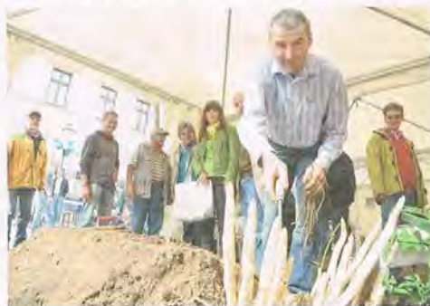
Am Samstag dreht sich in Schwetzingen alles um das Exportgut Nr. 1

Die Attraktionen des Spargelfestes werden durch einen langen Einkaufssamstag abgerundet - von 10 bis 20 Uhr kann nach Herzenslust geshoppert werden. Viele Einzelhändler locken mit besonderen Aktionen, dazu bieten zahlreiche Stände in der Mannheimer Straße Gegenstände und Erlebnisse an, die man so nicht überall findet, wie z. B. ein historisches Porträt mit der Fotobox am Stand der Volksbank eingangs der Fußgängerzone. Das Parken in den Parkhäusern und auf den Parkplätzen der Innenstadt ist am Spargelfest-Samstag kostenlos möglich.