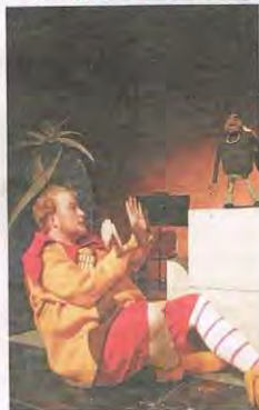
Papageno begegnet Monostatos

(red). Der lustige Vogelfänger Papageno begibt sich im Auftrag des Prinzen Tamino auf die Suche nach der Prinzessin Pamina. Mit Hilfe seines Glockenspiels und einer kleinen Zauberflöte versucht er, alle Hindernisse und Gefahren auf seiner Reise zu beseitigen. Es wird nicht einfach, denn der Weg ist lang, durch den Dschungel ... Papageno muss viele Abenteuer und Prüfungen bestehen. Eine Kinderoper für die ganze Familie mit den wunderbaren Puppen und Figuren des münchener puzzletheaters, spannend aufgeführt und liebevoll kindgerecht moderiert präsentiert die Mozartgesellschaft Schwetzingen