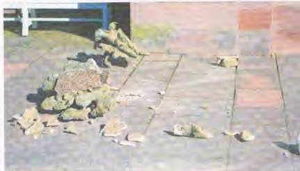
Das hätte ins Auge gehen können. Die Überreste der „gesprungenen“ Vase.

Am Mittwoch werden die derzeit noch auf den Dächern verbliebenen sechs Vasen mit Kranwagen und Hubsteiger entfernt. Die Reparaturkosten sind beträchtlich: In einer ersten Schätzung spricht das Amt von Vermögen und Bau Baden-Württemberg von Kosten von ca. 5.000 Euro je Stück. „Wir sind dem Amt Mannheim und Heidelberg von Vermögen und Bau Baden-Württemberg dankbar, dass es möglich war, gleich das ganze Ensemble zu untersuchen und einer Sicherung zu unterziehen“, erklärt Hörrmann. Man hoffe darauf, dass bald wieder die typische Silhouette der Zirkelbauten mit der reich geschmückten barocken Dachlinie hergestellt werden könne.