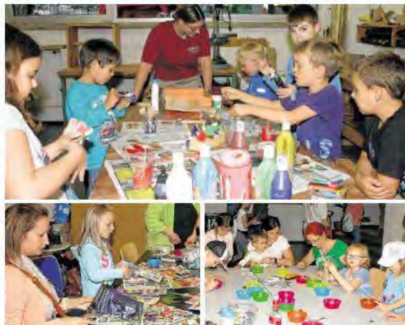
In der Holzwerkstatt (oben) stellen die Mädchen und Jungs mit großem Eifer schöne Schlüsselanhänger in Form von Bäumen oder Fußballern her. Auch mit Perlen und Buttons (unten) wurde gebastelt.

Die ganze Zeit gut besucht war auch die Topferwerkstatt. Dort waren die Kreativität der Kinder keine Grenzen gesetzt. So entstanden zum Beispiel „Hase Charly“ und „Schaf Lisa“. Danach brauchte man die Modellermasse nur noch aushärten zu lassen und konnte dann seine Figur getrost nach Hause tragen. Kleine