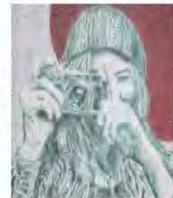
Filigrane Arbeiten wie die des Fotografin hat der Künstler mit dem Pinsel gemalt.