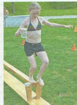
Balance war angesagt im GO IN.