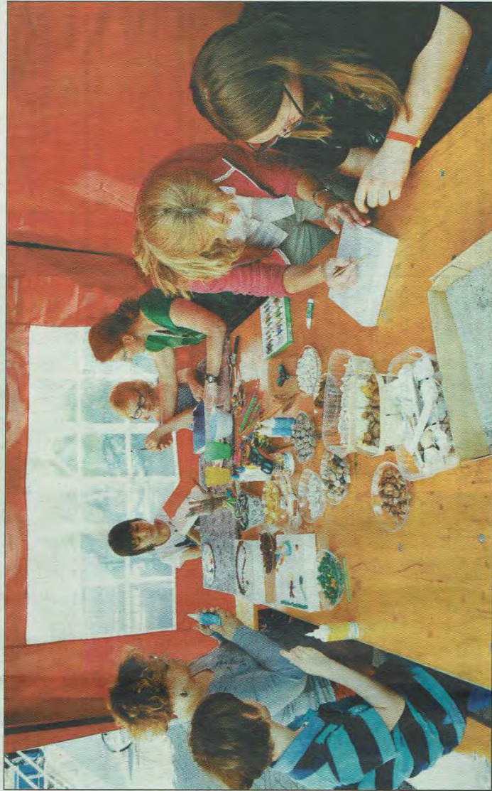
Entweder draußen auf dem weitläufigen Gelände oder drinnen wie auf unserem Bild in der Kreativwerkstatt, für die Kinder und Jugendlichen war beim „Tag der offenen Tür“ im Jugendzentrum „Go In“ wieder allerhand geboten.

Ein Vorhaben, das zumindest an diesem Tag aufzugehen schien. Hier gab und gibt es kaum etwas Trennendes. So zählt beim Blindenfußball nur Vertrauen und ein gutes Gehör. Und am Kletterfelsen war mehrfach zu beobachten, wie grö-