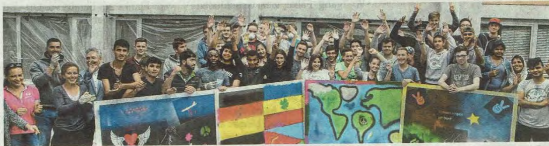
Sie können sich selbst bejubeln: Die Jugendlichen haben mit dem Kunstprojekt gezeigt, das Zusammenhalt stark macht.