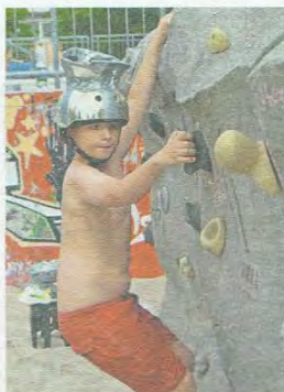
... oder auf dem Geschicklichkeits-Parcours