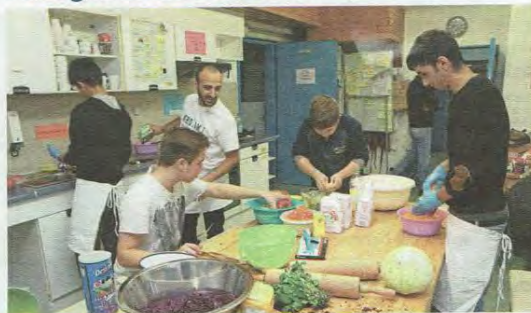
Frische Zutaten wurden in der „Funky Kitchen“ zu leckeren Speisen verarbeitet.