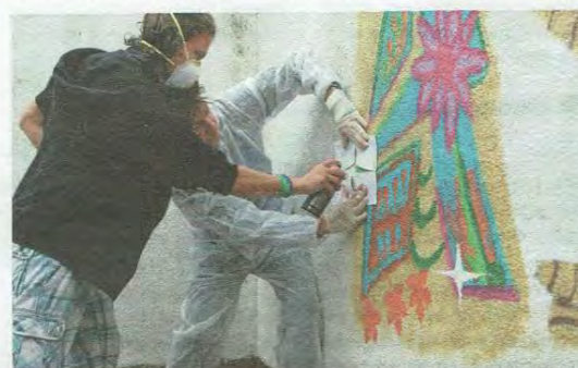
Auch Sprayen will gelernt sein.