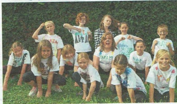
Dschungelhelden in der grünen Hölle.