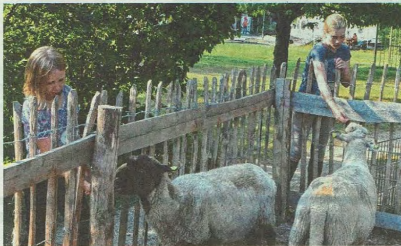
Amelie (l.) und Smilla haben ihren Spaß mit den beiden Schafen. Eifrig werden die Tiere gestreichelt – und sie genießen es.