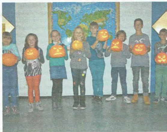
Stolz präsentieren die Kids ihre geschnitzten Kürbisse.

Augen, Mund, Zähne und Nase aus. Viele verschiedene Kürbiskopfcreationen wurden hergestellt, teilweise waren sie gruselig, manche aber auch freundlich. Während des Schaffens erzählten die Kinder von ihren eigenen Halloweenstreichen und wurden nebenbei auch darüber informiert, dass so mancher vermeintliche Streich nicht auf Gegenliebe stößt oder sogar strafbar ist. Nach rund 1,5 stündiger kreativer Schaffenszeit konnte jedes Kind dann einen tollen Halloween-Kürbiskopf mit nach Hause nehmen.