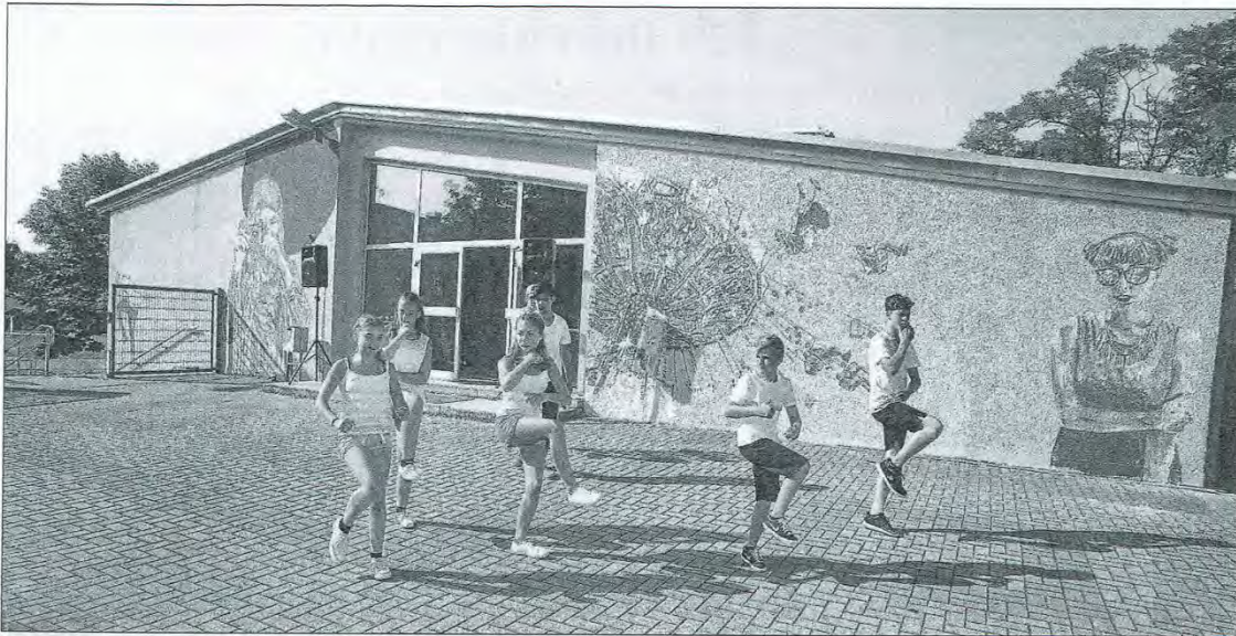
Ein flotter Hip-Hop und viele Graffiti auf der Fassade des Jugendzentrums „Go In“ war das Geschenk der Jugendlichen an ihre Heimatstadt im Jahr des 1250-jährigen Bestehens von Schwetzingen.