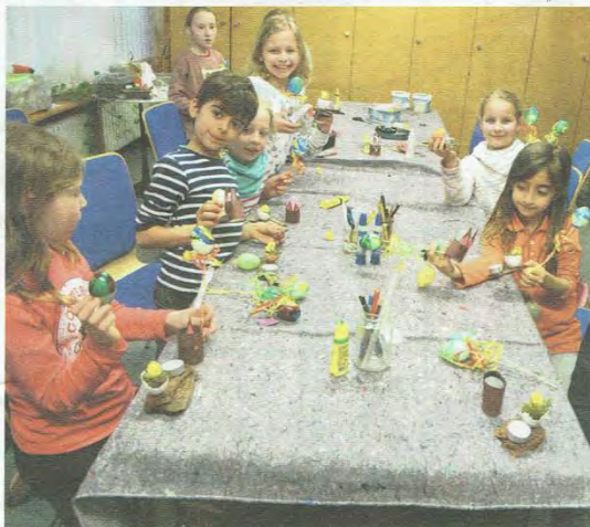
Stolz präsentierten die Kids das Endergebnis ihrer Bastelaktion.

Weitere Infos zu den Angeboten im GO IN gibt es unter www.goin-schwetzingen.de , direkt in der Kolpingstraße 2 oder unter Tel. 06202/10408.