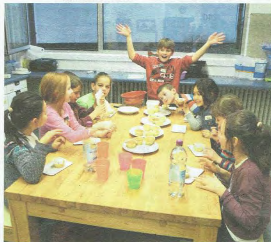
In der Muffinbäckerei.