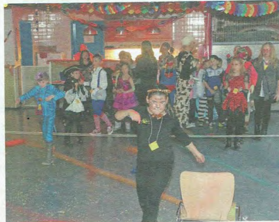
Geschicklichkeit war beim Eierlauf angesagt.

liger Nachmittag, bei dem die Kinder einmal völlig zu Recht im Mittelpunkt des närrischen Treibens stehen durften.