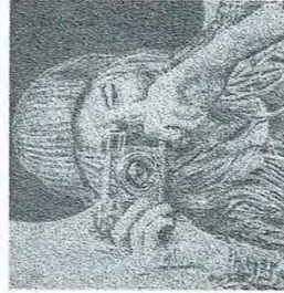
Filigrane Arbeiten wie diese Fotografien hat der Künstler mit dem Pinsel gemalt.