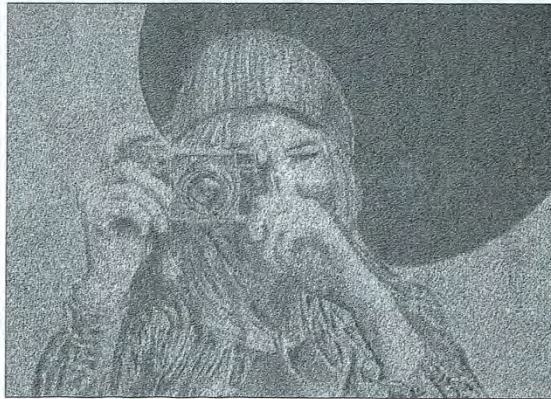
Mit dem Pinsel auf die Fassade des „Go In“ gemalt wurde dieses Kunstwerk.

Die Motive, die sich nun fanden, sind ein Stück Historie. Nicht unbedingt die der Stadt. Aber die der Menschen. „Schon viele Senioren haben uns auf das Kettenkarussell angesprochen und ihre eigenen Geschichten erzählt“, freute sich der Initiator, „daher war es vernünftig, nicht noch einmal mehr Carl Theodor an die Wand zu bringen.“