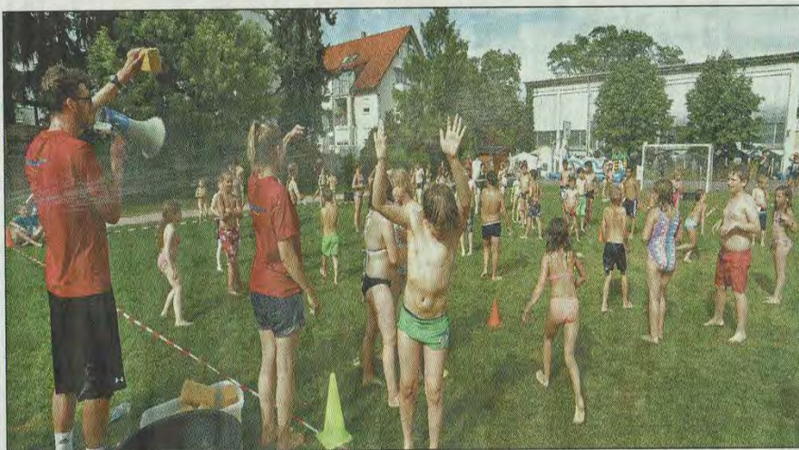
Beim Wassertag ging es naturgemäß feucht-fröhlich zu.

Am Ende gab es dann noch eine große Wasserschlacht in Form von Völkerball mit in Wasser getauchten Schaumstoffbällen. Ein Spiel, das sich wahrhaftig zur Mutter aller Wasserschlachten entwickelte und unübersehbar unbändigen Spaß machte. Die meisten der Kinder und Jugendliche hätten gerne noch einen zweiten oder sogar dritten Wassertag im Jugendzentrum GO IN. Für den sieben-jährigen Louis wäre das Ganze, einmal die Woche durchgeführt, perfekt.