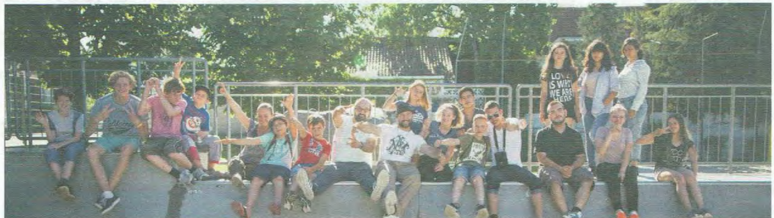
Die jungen Hip-Hop-Künstler beim Gruppenfoto auf der Rampe