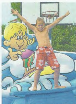
Egal ob beim Surf-Nachwuchs ...