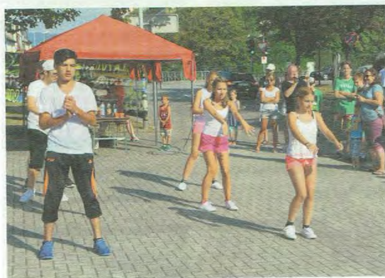
Einige Jugendliche hatten für das Projekt eine Hip-Hop-Choreographie erarbeitet.