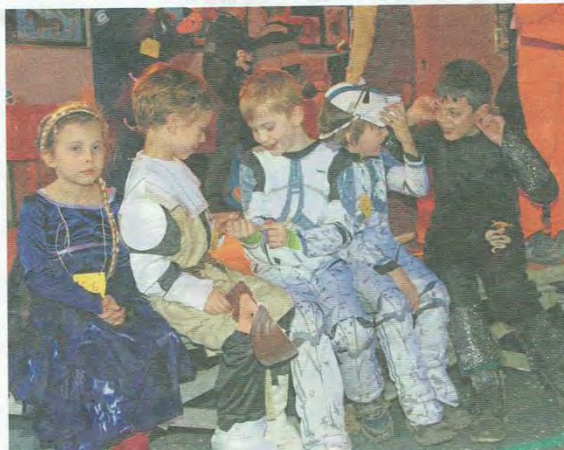
Die Kinder hatten ihren Spaß beim Kinderfasching.