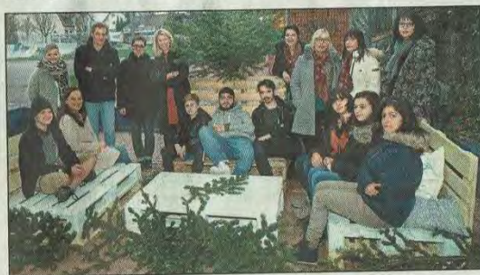
Aus den aus der Spende der Herz-Damen angeschafften Paletten basierten Jugendliche Sitzmöbel und Tische fürs „Go In“.

Angesichts so viel Zuspruch war es für die Herz-Damen dann auch nur ein kleiner Schritt zu dem Beschluss, die Aktion „Schwetzingen zeigt Herz“ über das Jubiläumsjahr hinaus zu verlängern. Auch im kommenden Jahr werden die Herz-Damen aktiv sein und Herz und Herzlichkeit wieder auf ihr Schild heben.