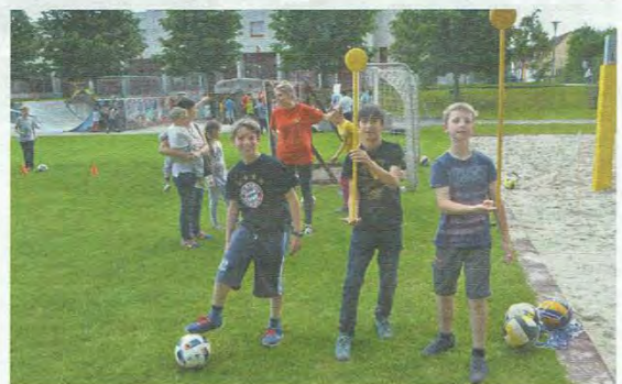
Bewegung stand im GO IN zum Tag der offenen Tür hoch im Kurs - sei es beim Klettern, bei Ball- oder bei Geschicklichkeitsspielen.

sei dabei der menschlich-soziale Aspekt nicht zu unterschätzen, denn auch Spaß und Geselligkeit kommen nicht zu kurz.