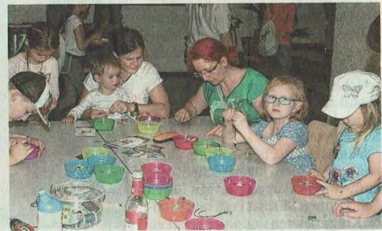
In der Holzwerkstatt (oben) stellten die Mädchen und Jungs mit großem Eifer schöne Schlüsselanhänger in Form von Bäumen oder Fußballern her. Auch mit Perlen und Buttons (unten) wurde gebastelt.