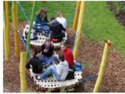
3 GROßE HÄNGEMATTEN