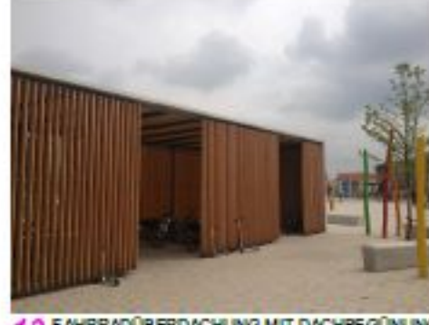
13 FAHRRADÜBERDACHUNG MIT DACHBEGÜNGUNG